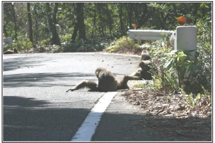
写真 4. 道端でグルーミング