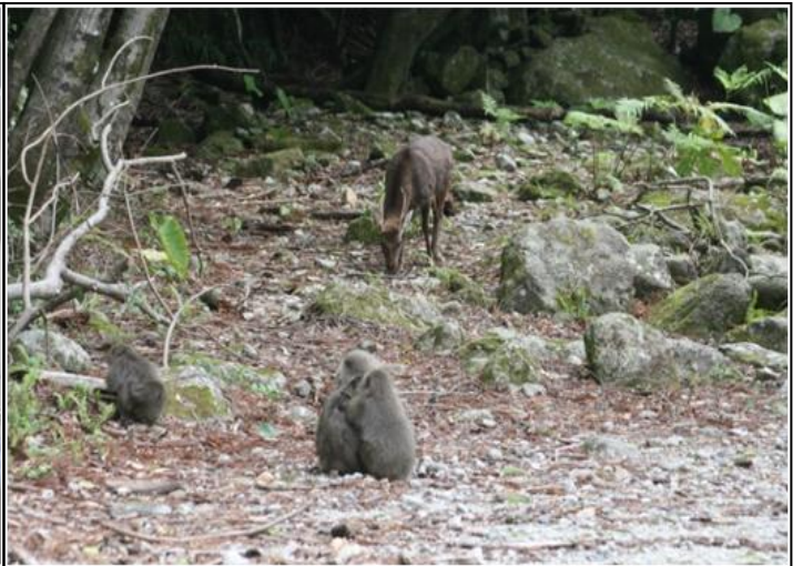
写真 2. ヤクシマサルとヤクシカ