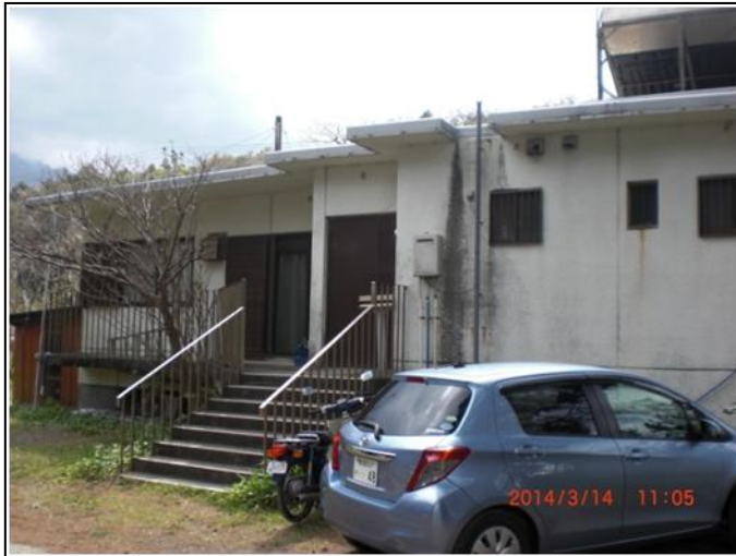
写真 1. 屋久島観察ステーション