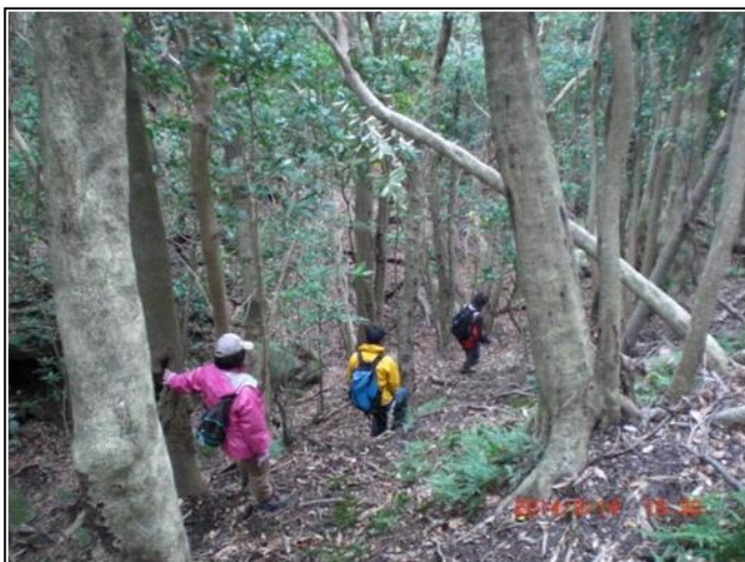
写真 5. 西部林道を外れてサルを搜索