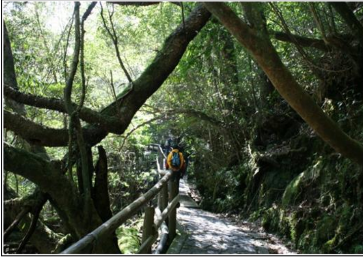
写真 6.白谷雲水峡の入口付近 (遊歩道が整備されており、歩きやすい)