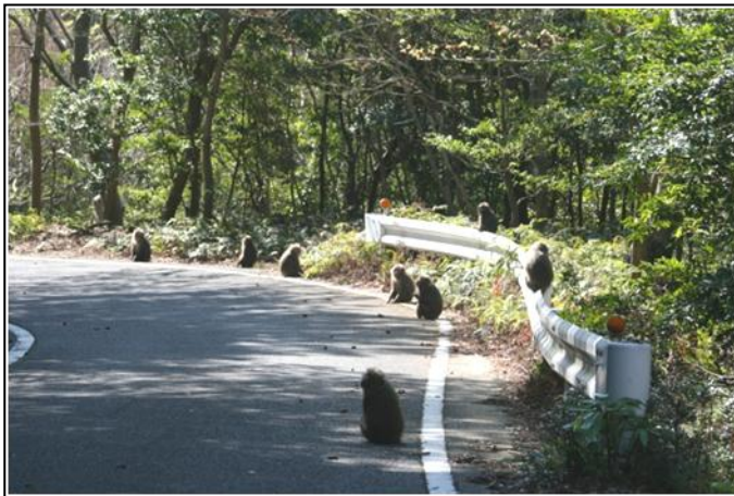
写真 3. 道で遭遇したヤクシマサルの群れ